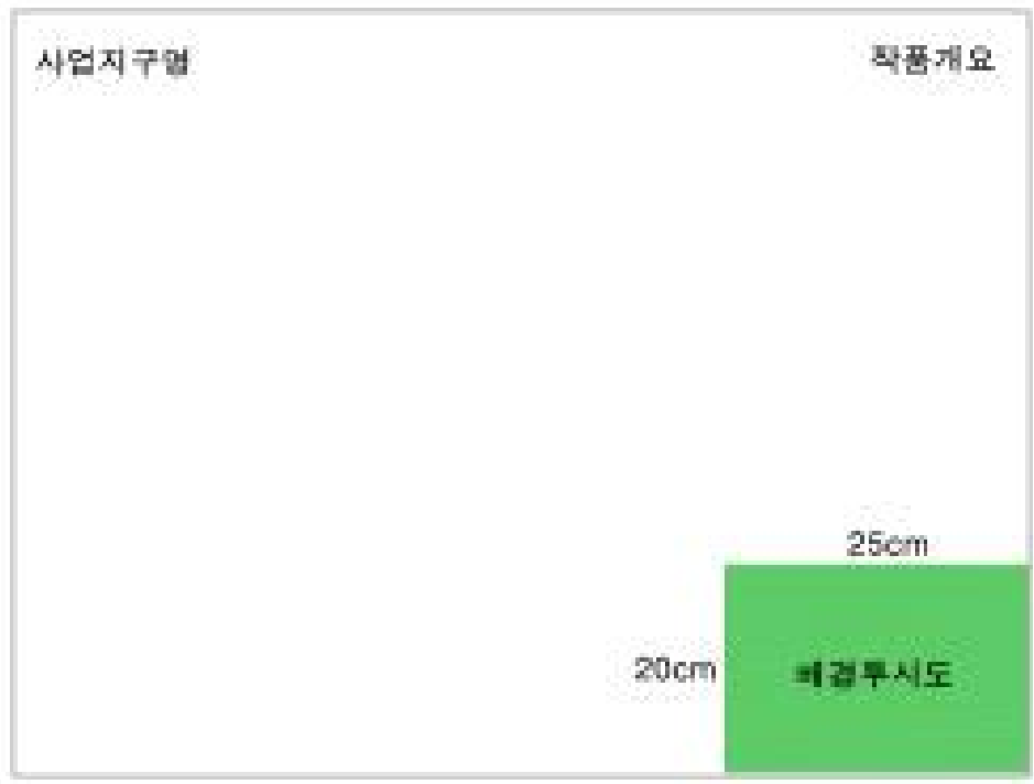
< 도 판 예 시 >