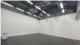
G1 프로젝트 스페이스 1 Project Space 1