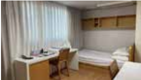
F 게스트 레지던스 Guest Residence