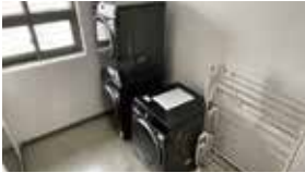
E 스튜디오 세탁실 Laundry Room