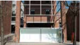
E3 프로젝트 스페이스 3 Project Space 3