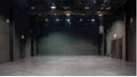
C 공연장 Theater