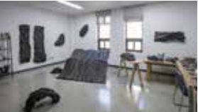
2021 오픈스튜디오 전경 Studio View of "2021 Platform Open Studio"