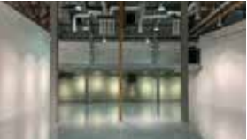
B 전시실 1 Gallery 1