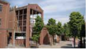
E 스튜디오 외부 Studio (Outside)