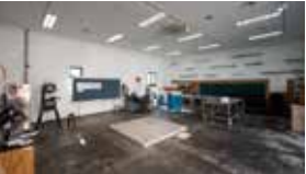
G2 공동작업실 Communal Studio