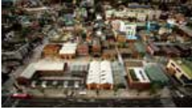
인천아트플랫폼 전경 Overview of Art Platform