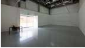
E1 전시실 2 Gallery 2