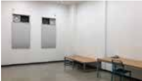
E 스튜디오 내부 Studio (Inside)